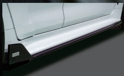
B サイドディフューザー