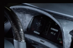
P メーターインナーフード