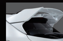
H リヤルーフウイング