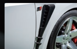
F サイドフェンダーガーニッシュ