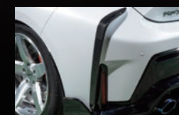
G リヤバンパーガーニッシュ