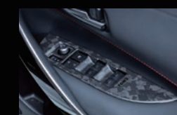
O ドアスイッチパネル