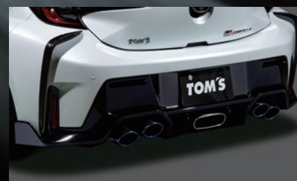
C リヤバンパーディフューザー