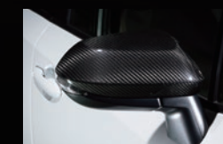
I ドアミラーカバー