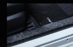
M フロントスカッフ