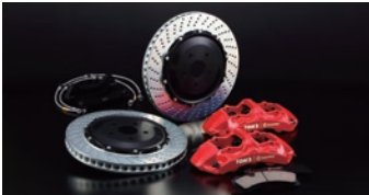
01 ブレーキシステム「TOM'S×brembo」 仕 様 フロント:モ/ブロック6ポッドキャリパー、355φ2ピースローター リヤ:モ/ブロック4ポッドキャリパー、345φ2ピースローター