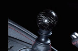
S カーボンシフトノブ