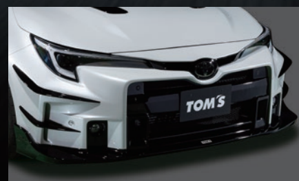
A フロントバンパー