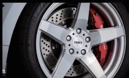
E TOM'S 'TWF01' 18×8.5J+25 5H/114.3