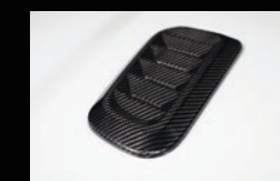
J ボンネットフードダクト