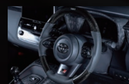
K トムス・ステアリング「カーボン」