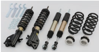
02 サスペンション キット「Advox Sports」 仕 様 全長調整式 減衰力20段調整式