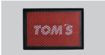
04 エアフィルター「スーパーラムⅡストリート」 仕 様 純正交換タイプ