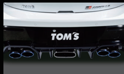
D エキゾーストシステム「トムス・バレル」