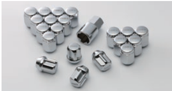
03 セキュリティホイールナット 仕 様 21HEX M12xP1.5 カラー:クローム