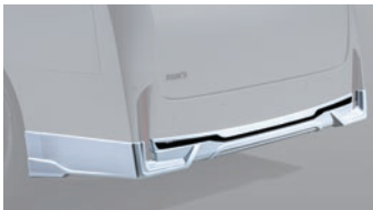
03 リヤアンダースポILER ⚠

仕様 保安基準適合 素 材: ABS 製 全 幅: 約 14mm プラス 地上高: 約 23mm ダウン 2.0H 7.0H