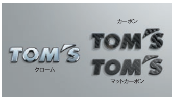
06 TOM'S エンブレム

仕様 サイズ: 21HEX M14 × P1.5 60°テーパー座 カラー: クローム ブラック