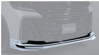
01 フロントアンダースポILER ⚠

仕様 保安基準適合 素 材: ABS 製 全 長: 約 15mm プラス 地上高: 約 32mm ダウン 1.5H 5.0H