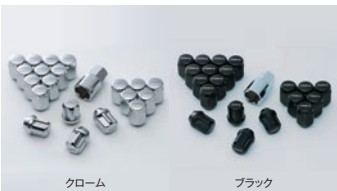
05 セキュリティホイールナット

仕様 アルミ鍛造ワンピース 20 × 8.5J+45 5H/120 カラー: グロスブラック スパッタリング 2.2H