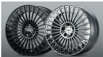
04 TOM'S TWF05

仕様 保安基準適合 素 材: ABS 製 全 長: 約 13mm プラス 地上高: 約 25mm ダウン 1.5H 5.0H