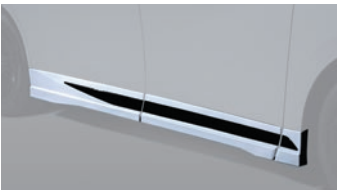
02 サイドスポILER ⚠

仕様 保安基準適合 素 材: ABS 製 全 長: 約 15mm プラス 地上高: 約 32mm ダウン 1.5H 5.0H